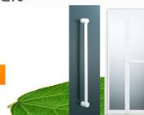
バリアフリー改修工事