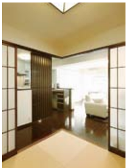
デザインの統一性を図り、スタイリッシュに仕上げた和室（50万円）