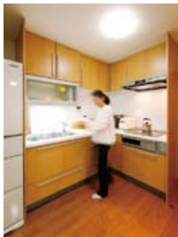
ゴミ箱も内蔵するなど、使い勝手におどろいたキッチン（114万円）