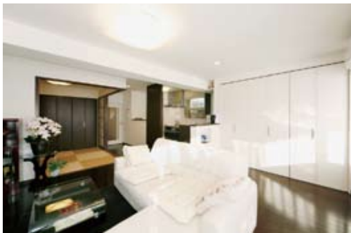
光を遮断していた2つの個室を取り払い、明るく広いLDKを実現。既存の家具の色に合わせて、室内デザインを選定（320万円）（写真は全て施工例）