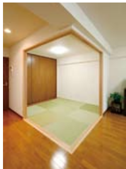
襖を開放すれば、LDKと一体利用できる和室（45万円）