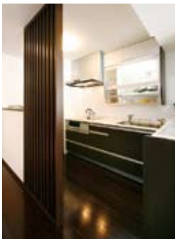
目隠しとアクセントの役割を担う格子を配したキッチン（177万円）