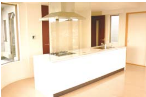
施主の好みの白を基調にしたシンプルモダンなキッチン。窓からの景色が眺められるよう、アイランドタイプを提案(写真は全て施工例)