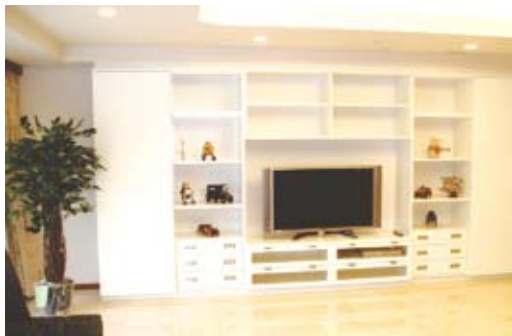
天然大理石敷きの床、折上げ天井、間接照明などを配した、上質感あふれるリビング。壁一面には、家具専門設計者による造作家具を設置